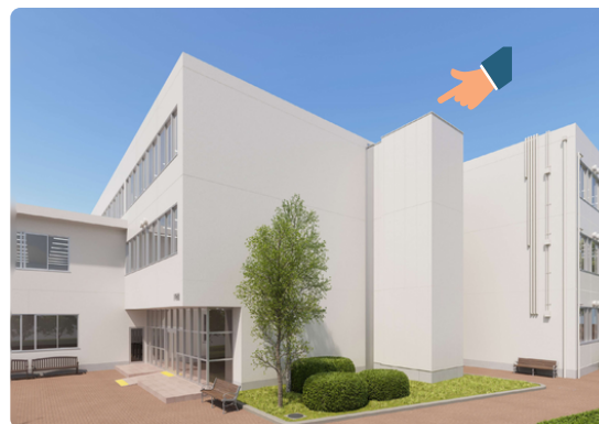
エレベーター設置予想図