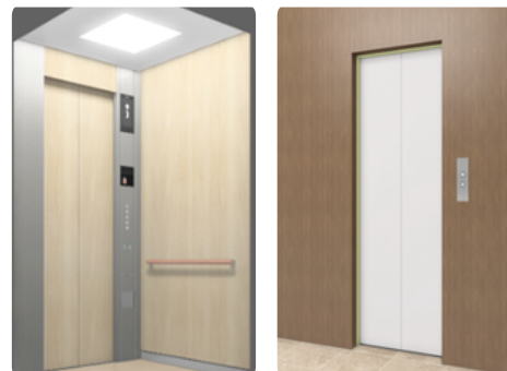
エレベーター内装外装