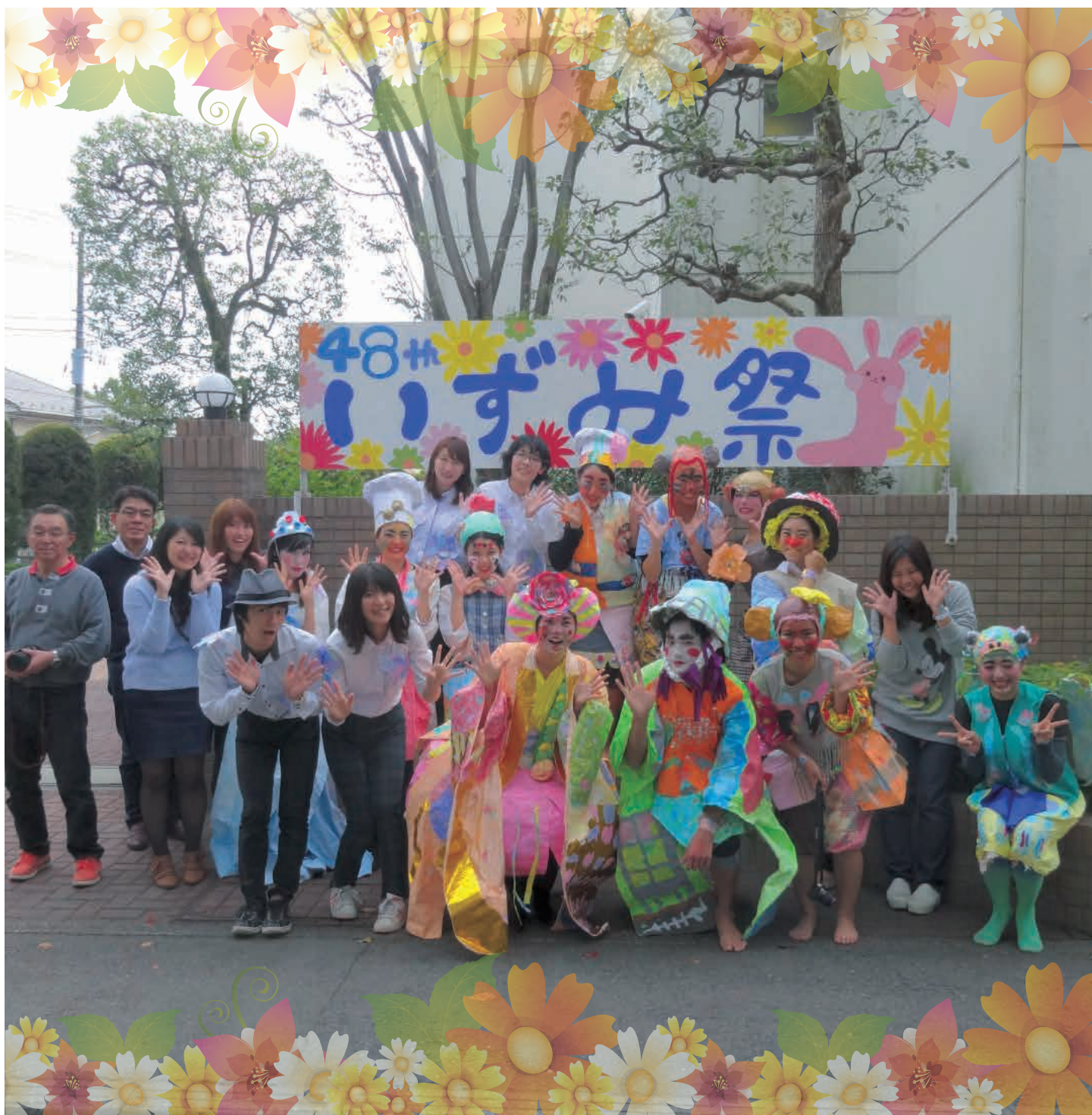
f facebookページ開設中! 『いいね!』を押してください。