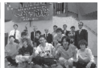
▲男子バスケットボール