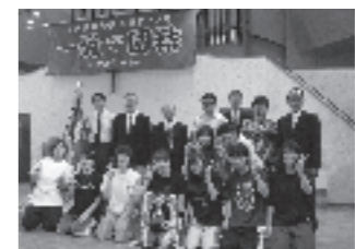
▲女子バスケットボール