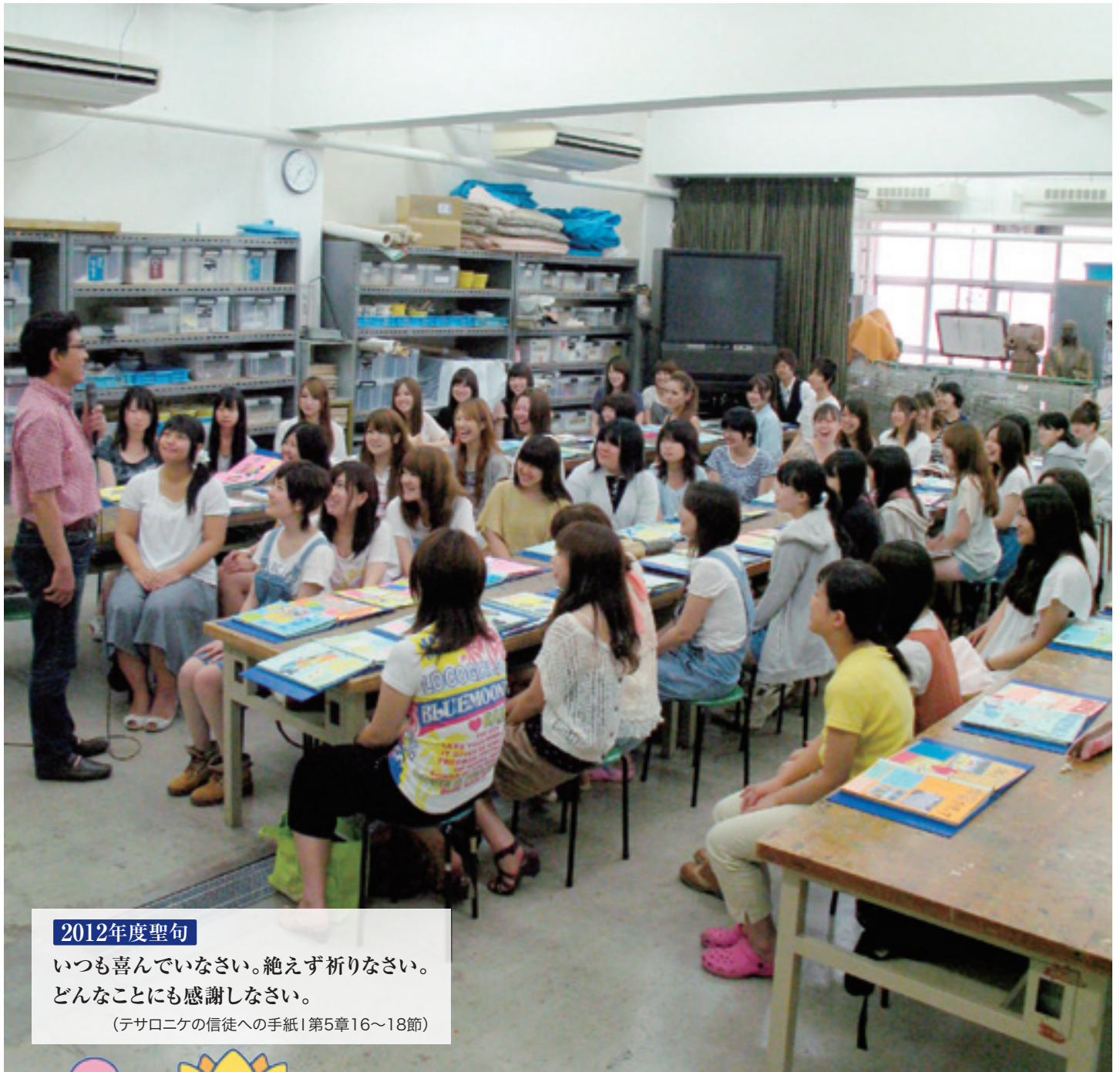
「造形表現」1年生の授業