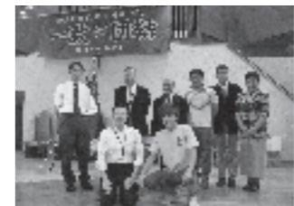
▲男子バドミントン