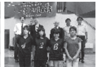
▲女子バレーボール