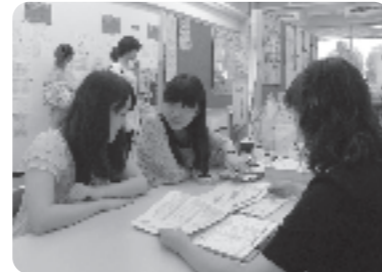
▲進路支援センター